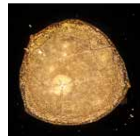
Nikolaifleet / Tropfen aus dem Nikolaifleet