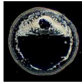
Alsterquelle mit Eisenplatte / Tropfen aus der Alsterquelle